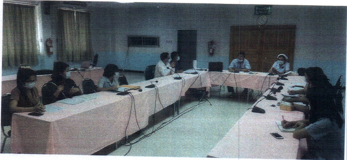
ภาพถ่ายการประชุม วันที่ ๓ กุมภาพันธ์ พ.ศ. ๒๕๖๔ ณ ห้องประชุมชั้น ๒ อาคารทันตกรรม โรงพยาบาลเทพสถิต